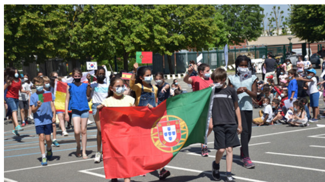
Ouverture de la semaine olympique et paralympique avec les élèves de l'école Marcel-Pagnol, de la grande section au CM2.

Élèves et équipe éducative de l'école Marcel-Pagnol, labélisée « génération 2024 », ont vécu la deuxième édition de la semaine olympique et paralympique. De nouveau cette année, la semaine a été ouverte et clôturée comme pour les vrais Jeux et les élèves, de la grande section au CM2, ont pu pratiquer du sport tous les jours avec des intervenants qualifiés (athlétisme, handball, rugby, mais aussi boxe, escrime, etc...). Ils ont également été sensibilisés au sport paralympique à travers des mises en situation et des rencontres avec des athlètes non valides. ■