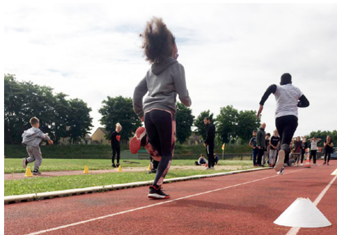
Journée internationale olympique et paralympique avec l'École municipale des sports (EMS) au stade Le Coadic - 23 juin 2021

Mercredi 23 juin, lors de la journée internationale olympique et paralympique, tous les enfants de l'EMS (École municipale des sports), âgés de 4 à 11 ans, ont également participé à des activités sportives au stade Le Coadic. Cette journée, placée sous les valeurs de l'olympisme, a rencontré un grand succès auprès des enfants et de leurs parents !