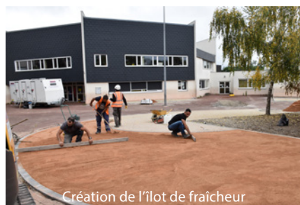
Création de l'îlot de fraîcheur

La cour de cet établissement scolaire étant exposée sud-est et disposant de très peu d'espaces verts, une forte nappe de chaleur y est présente. C'est pourquoi, la Municipalité a décidé de réaliser un îlot de fraîcheur sur les cours des deux écoles maternelles et élémentaires dont le montant s'élève à plus de 97 956 €.