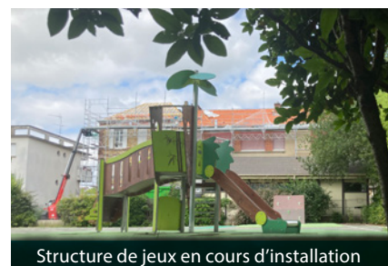
Structure de jeux en cours d'installation

Les cours des écoles maternelles Marie-Curie et Anne-Frank sont équipées d'une nouvelle structure de jeux en bois, pour un montant de plus de 29 000 €.