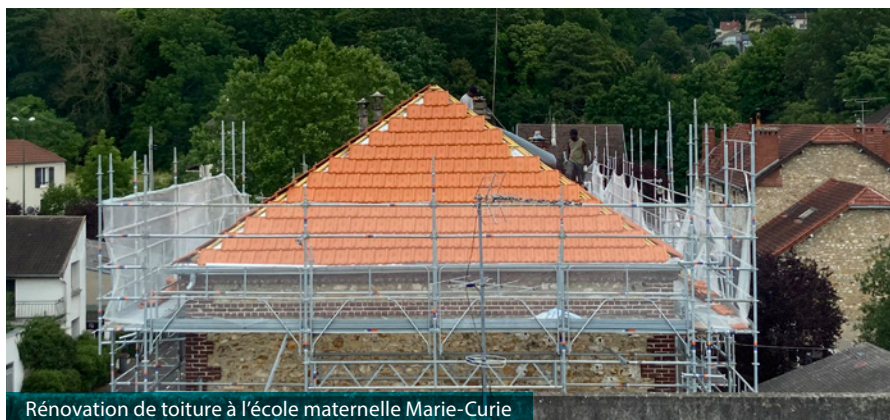
Rénovation de toiture à l'école maternelle Marie-Curie