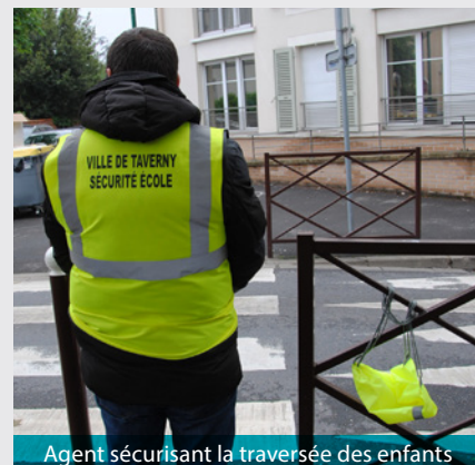
Agent sécurisant la traversée des enfants

Depuis avril 2016, en lien avec la Municipalité, l'association Smart Rebond met à disposition des salariés en insertion professionnelle pour la traversée des écoles élémentaires. À ce jour, 9 salariés permettent de sécuriser la traversée des enfants. Ces agents sont intégrés à part entière à l'équipe éducative de l'établissement. Ainsi, le jour de la rentrée, ils sont accueillis par les agents du périscolaire pour prendre part à la photo de l'équipe d'encadrement. Ils rencontrent ainsi l'ensemble des animateurs et visitent les locaux de leur école de secteur avant de suivre une formation délivrée par la police municipale.