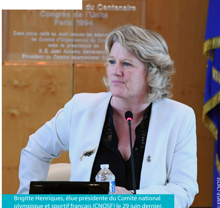
Brigitte Henriques, élue présidente du Comité national olympique et sportif français (CNOSF) le 29 juin dernier.

Dans moins de trois ans, la France accueillera les prochains jeux olympiques. D'ici là, nous avons beaucoup de travail! Je me suis entourée d'une équipe de douze bénévoles et j'ai construit un programme de 121 mesures avec l'ensemble des fédérations qui me soutiennent. Je souhaite avant tout